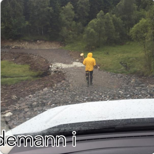
Kjekt med sidemann i regnværet.